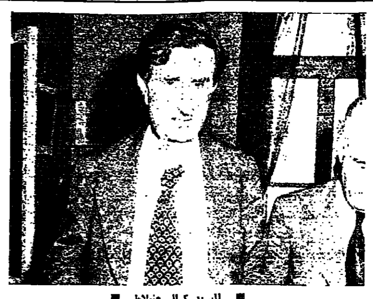
السيد كمال جنبلاط

التزم السيد كمال جنبلاط أمس ، بقول « خفة » التصريحات السياسية واستعاض عنها بقرعة التمسك الصوري ، إلا أن هذا التمسك لم يدل نون صدور بعض المقترحات والتوصيات بالنسبة للأزمة الوزارية.